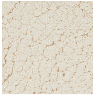
weiß auf tan 4101