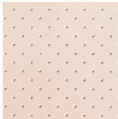
Rindleder TL, hellbeige