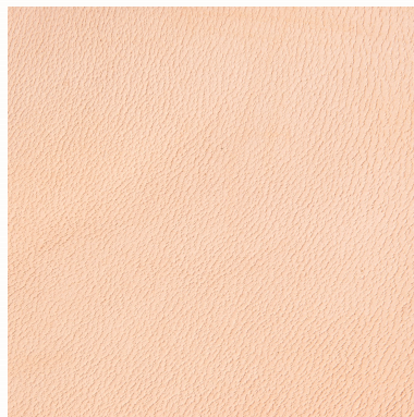
VegLine, Blankleder, natur